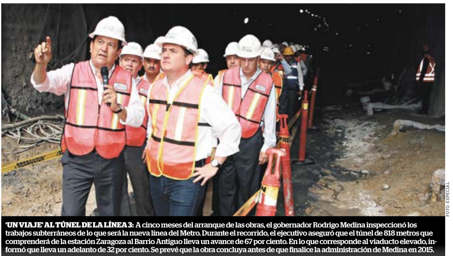
'UN VIAJE' AL TÚNEL DE LA LÍNEA 3: A cinco meses del arranque de las obras, el gobernador Rodrigo Medina inspeccionó los trabajos subterráneos de lo que será la nueva línea del Metro. Durante el recorrido, el ejecutivo aseguró que el túnel de 818 metros que comprenderá de la estación Zaragoza al Barrio Antiguo lleva un avance de 67 por ciento. En lo que corresponde al viaducto elevado, informó que lleva un adelanto de 32 por ciento. Se prevé que la obra concluya antes de que finalice la administración de Medina en 2015.